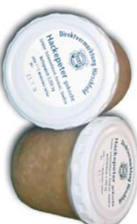
Hackepeter im Glas