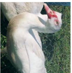
Weidemastgänse- und enten